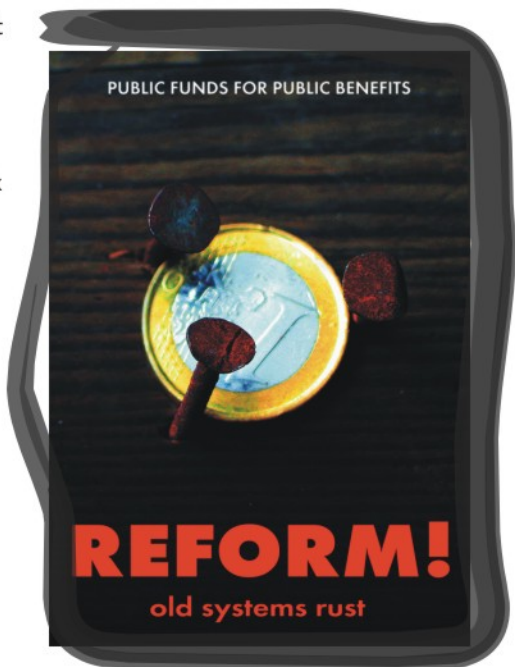
REFORM! A régi rendszerek berozsdásodtak Marcin Michon (PI)

Annak ellenére, hogy az EIB saját állítása szerint az Unió politikái által irányított közintézmény, gyakorlatilag kereskedelmi bankként működik.