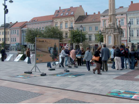
Utcai akció Szombathelyen