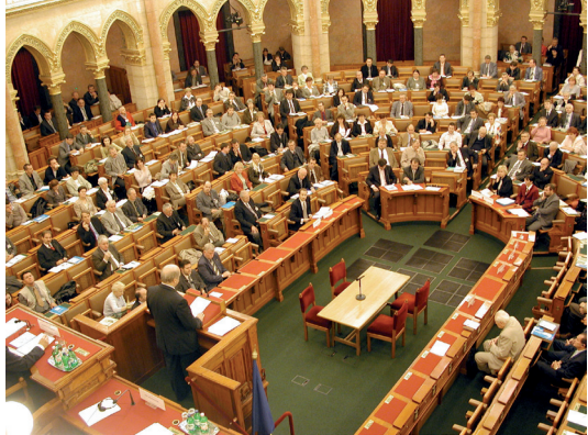
Konferencia a Parlamentben