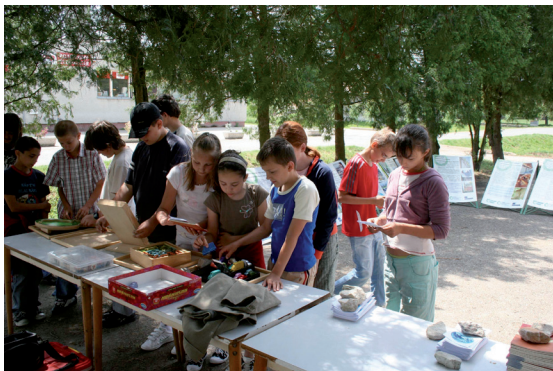
Utcai akció Szlovákiában