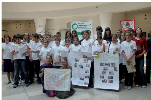
A klímaőrjárat eredményhirdetése

Iskolai tevékenységeink fókuszában egy olyan vetélkedősorozat állt, melyben a résztvevő csapatok körbejárták az éghajlatváltozás problémás területeit, és a feladatok közt maguk állítottak össze egy, a saját intézményükre vonatkozó javaslatcsomagot.