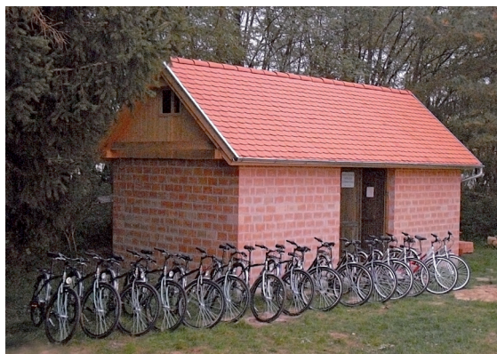
A program keretei közt elkészült biciklitároló és a kerékpárok

Az Ipeľská únia környezeti oktatóközpontja építésének, felújításának keretében megvalósult a tervezett klímavédelmi beruházás. Az oktatóközpont területén 5 db szállásépület ill. egy nagy központi épület található. Az oktatási célra való használaton felül a létesítmény környezetkímélő és energiatakarékos technológiák bemutatására is szolgál majd. A projekt keretében megvalósult beruházás az egyik dupla faépület infravörös fűtési rendszerének kialakítása, mely reményeink szerint 30-40 %-os energiamegtakarítást eredményez.