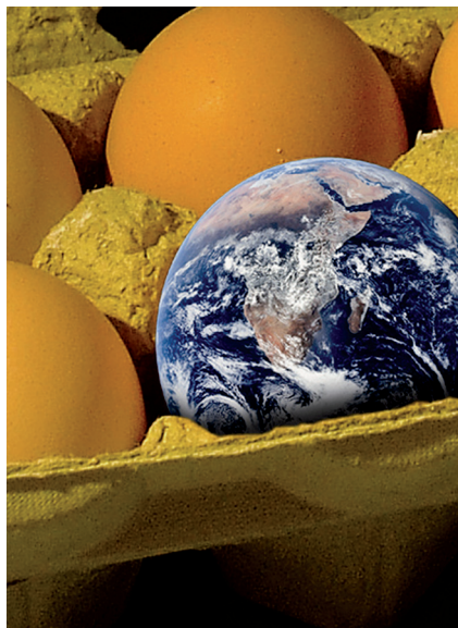
Globális felmelegedés – a változás képei Fotó- és rövidfilm pályázat Éles Tibor Viktor / Global

Az éghajlatváltozás problémája túlmutat annak környezeti hatásain, és jelentős társadalmi és gazdasági problémákat vetít előre. Programunk keretei közt ezt a problémát igyekeztünk színes eszközökkel megismertetni Magyarország és Szlovákia kiemelt célcsoportjaival – helyi közösségekkel, önkormányzatokkal, diákokkal és politikai döntéshozókkal – valamint a lakosság szélesebb rétegeivel. Természetesen azt is vizsgáltuk, hogy a probléma megoldásának milyen lehetőségei vannak a közép-európai térségben helyi és országos szinten. Kiadványunkban bemutatjuk a program tevékenységeit és eredményeit.