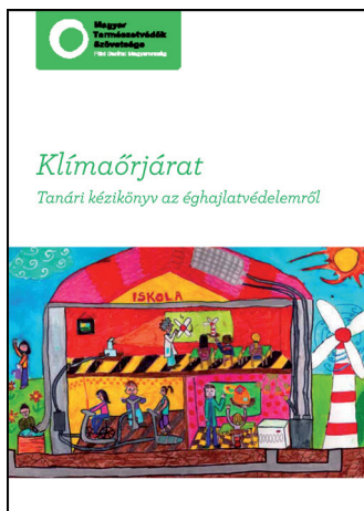
Klímaőrjárat - Tanári kézikönyv

A vetélkedő legjobb rajzait, anyagait is felhasználó tanári kézikönyv és diák szórólap készült, melyet a résztvevő csapatoknak, iskoláknak kiküldtünk, ill. rendezvényeinken célzottan terjesztettünk tanárok, diákok részére.