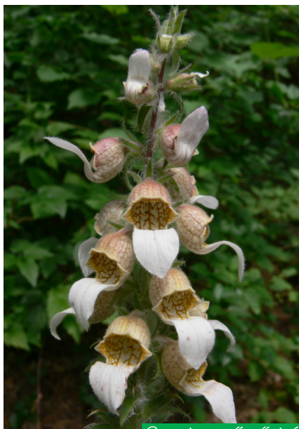
Gyapjas gyűszűvirág ( Digitalis lanata )

A falak sok helyen omlékonyak, de a felső bányaudvar szilárd keleti falrészét sziklamászók használják gyakorlólépként. A kőfejtő Budapest egyik legnagyobb kiépített sziklamászó iskolája.