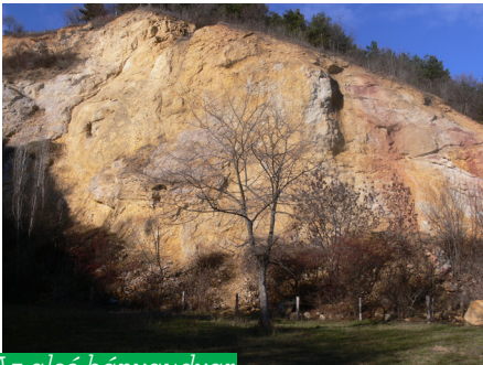
Az alsó bányaudvar márgás fala