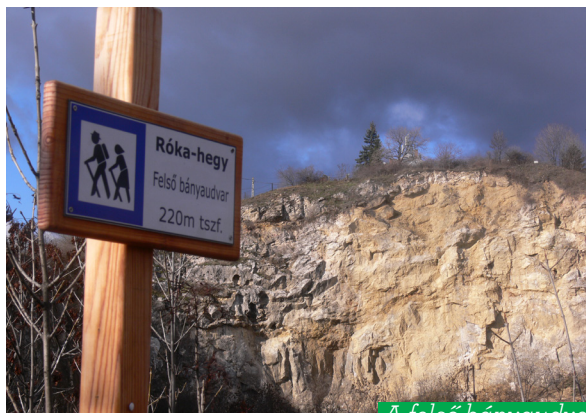
A felső bányaudvar

A Róka-hegy Budapest jelentős természeti értéke, 1977 óta a főváros védett természeti területe, mely engedély nélkül látogatható. A felhagyott, három bányaudvar részre elkülönülő kőbánya jelentős geológiai és botanikai értékekkel bír. A terület védetté nyilvánításának célja elsősorban a művelés során feltárt geológiai emlékek védelme és bemutatása volt: a részben alapszelvényként számon tartott, eocén, oligocén képződményeket és paleokarszt formákat magába foglaló földtani értékek megőrzése, valamint a bányához tartozó értékes növény- és állatvilág védelme. A kőbányában három szinten: középidőből származó triász korú „dachsteini” mészkő, újidő harmadkori eocén „szépvölgyi” mészkő és oligocén „tardi” agyag, valamint márgás-mészköves konglomerátum, a kibillent márgarétegek között metamorf kőzetek, zöldkövesedett andezitkavicsok találhatóak. Az egész bányában óriási vetősíkok figyelhetők meg, elsősorban a középső bányaudvar bejáratánál. A bánya középső részében a hévizes források által formált, limonitos kitöltésű gömbfűlkés barlangrendszer közelről is megvizsgálható. A bánya területén több hévizes barlang és barlangkezdemény (oldásüst, kürtő-rom) található.