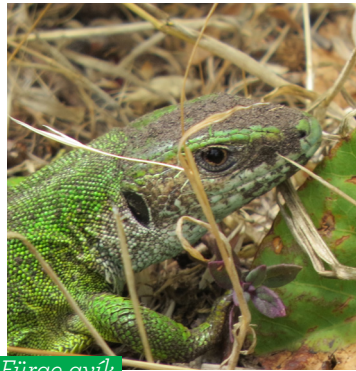
Fürge gyík ( Lacerta viridis )

Az állatvilág a terület nagyságához, méretéhez képest gazdagnak mondható. A bogarak és a lepkék közül a melegkedvelő, pusztai sztyeppfajok a legértékesebbek. Az ízeltlábú faunában fellelhető hazánk védett, legnagyobb futrinka faja a bőrfutrinka, valamint a keleti rablópille, nappali pávaszem, kardoslepke, fecskefarkú lepke, atalanta-lepke, dolomit kéneslepke, nagy pávaszem, közepes pávaszem, ragyás futrinka, rezes futrinka, gyászscincér, kékszárnyú- és imádkozó sáska. Hüllők közül gyakori a fürge gyík,