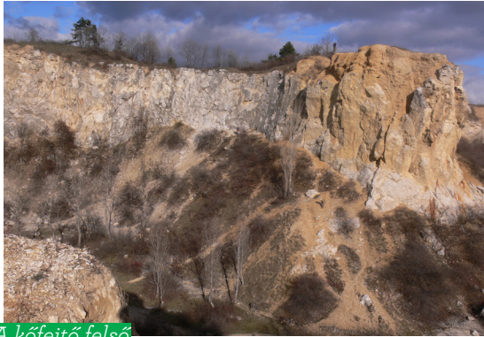
A kőfejtő felső udvara

Az eredetileg sekély-tengeri üledékként lerakódott triász mészkő karsztos oldással bővített üregeiben helyenként szárazföldi eredetű agyagos kőzet látható (színe általában vörös, sárga, barna). Másutt az üregeket breccsás törmelék tölti ki, mely a triász mészkő karsztos felszínére és mélyedéseibe rakódott le a közeli sziklapartok