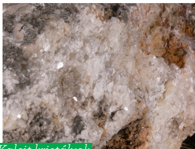
Kalcit kristályok mészkővön

A Róka-hegy kőfejtői több hévizes eredetű üreget is feltártak. Ilyen a régóta ismert Kristály-barlang hossza kb. 30 méter, mélysége mintegy 10 méter a falait gazdag borsókő képződmények borítják. Az 1959-ben feltárt Róka-hegyi-barlang az ettől nyugatra lévő kőfejtőben nyílik, mely a magyar természet- és barlangvédelem