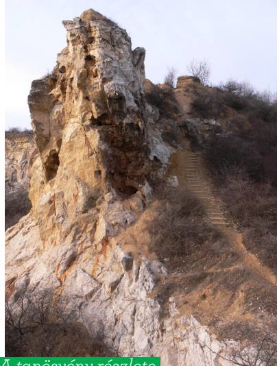
A tanösvény részlete

Az itteni kőfejtő volt a főváros legnagyobb mészkőbányája, ahol az 1930-40-es évekig folyt kitermelés. Az egykori felső bányaudvar két részből áll: egy nagyobb alsó és egy kisebb, felső részből. A legfelső bányaudvar délnyugati pontjáról szép kilátás nyílik a városra, és az egész védett területre. Ezzel szemben indul el az a sétaút, melyet követve juthatunk le az alsóbb bányaudvarokba. A középső udvar, amelyet a Rózsa utca felől is megközelíthetünk, nagy kiterjedésű sík, nyílt térrel rendelkezik. Keleti részén korláttal védett