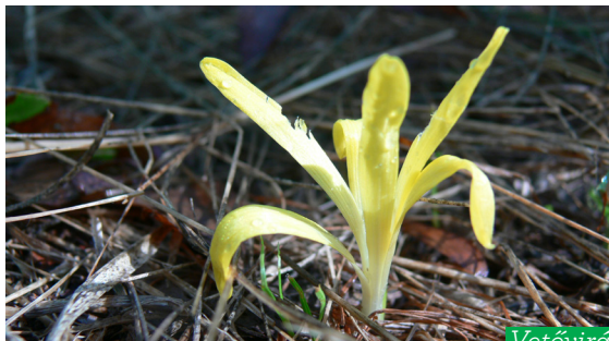
Vetővirág ( Sternbergia colchiciflora )