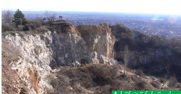
A kőfejtő felső udvara

kilátóhely található. A korlát mellett halad az alsó bányaudvarba vezető út. A kőfejtő legalsó, Ibolya utca felől is megközelíthető részén kisebb pihenőhelyet és esőbeállót alakítottak ki.