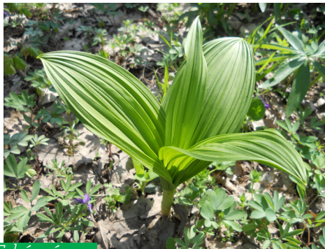
Fehér zászpa ( Veratrum album )

Botanikai értékekben talán az alsó láprét a leggazdagabb. Megtekintését a patak gátján futó úton haladva javasoljuk. Letérni nem szabad, és nem is érdemes. A csodálatos látványt nyújtó védett növények csak itt mutatnak szépen, kiásva vagy leszakítva nem maradnak életben. Pusztításuk szigorú büntetést von maga után.