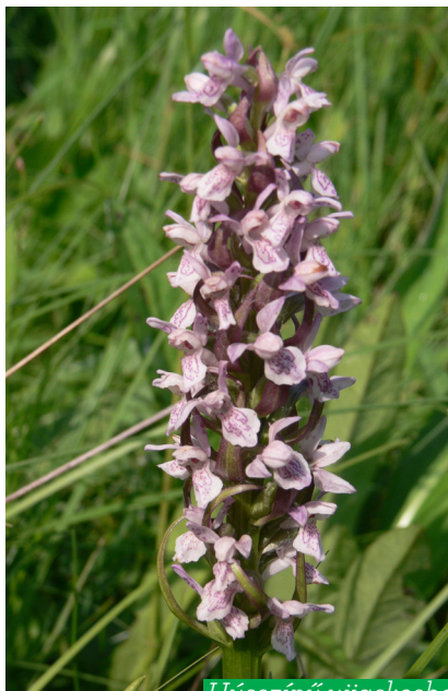
Hússzínű ujjaskosbor ( Dactylorhiza incarnata )

A 16 hektáros Naplás-tó és környéke Budapest második legnagyobb, összesen 152 hektáros természetvédelmi területe. Ebbe beletartozik a Naplás-tó, a tavat tápláló Szilas-patak egy része és az azt követő láprétek, illetve a Cinkotai-kiserdő is.