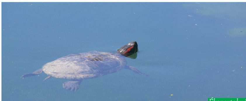
Ékszerteknős ( Trachemys scripta elegans )