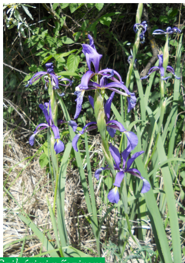
Szibériai nőszirm ( Iris sanguinea )