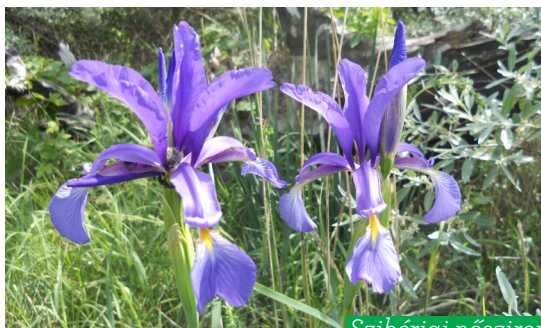
Szibériai nőszirm ( Iris sanguinea )

Ezen a területen eredetileg a Szilas-patak völgyében egy botanikailag igen értékes időszakosan vízzel borított láprét volt, ennek maradványai a patak mentén elhelyezkedő láprétek és a fűzláp értékes növényekkel büszkélkedhet. Ilyen például a szibériai nőszirm, amelynek az egyik legnagyobb budapesti állományát itt találjuk. Megtalálható még a strucc-haraszt, a hússzínű ujjaskosbor és a réti iszalag.