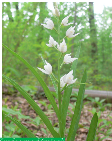
Kardos madársisak ( Cephalanthera longifolia )

A Naplás-tó és környezete a Budai Tájvédelmi Körzet után a főváros második legnagyobb, 152 hektáros természetvédelmi területe.