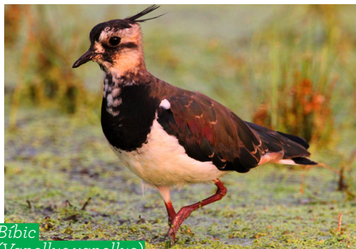
Bíbic ( Vanellus vanellus )

A madarak közül több mint 200 madárfajt figyeltek meg a környéken. Jelentős részük csak átutazóban pihen meg itt ősszel és tavasszal. Ezekben az időszakokban több mint százötven különböző fajú szárnyással találkozhatunk, de a madárvilág évközben