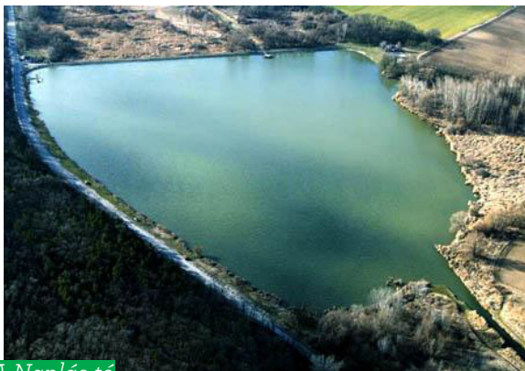
A Naplás-tó madártávlatból

Az Erdeőkerülő utcai buszmegállótól körülbelül öt percet kell sétálnunk. A terület a 146A jelű busz Cinkotai garázs végállomásától is megközelíthető kis sétával.