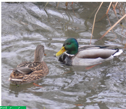
Tőkésréce ( Anas platyrhynchos )

A területen megfigyelt kis fakopáncs, nagy fakopáncs, zöld küllő, fekete harkály, füstifecske, molnárfecske, parti fecske, rigófélék, poszátafélék, pintyfélék, széncinege, kékcinege, barátcinege, őszapó, csuszka, fakusz, sárgarigó, holló már nem kötődik a vízi élettérhez. A ragadozókat az erdei fülesbagoly, egerészölyv, héja, karvaly, barna rétihéja, vörös vércse és a ritka kabasólyom képviseli.