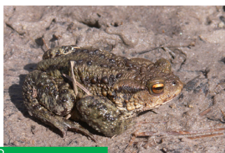
Barna varangy ( Bufo bufo )