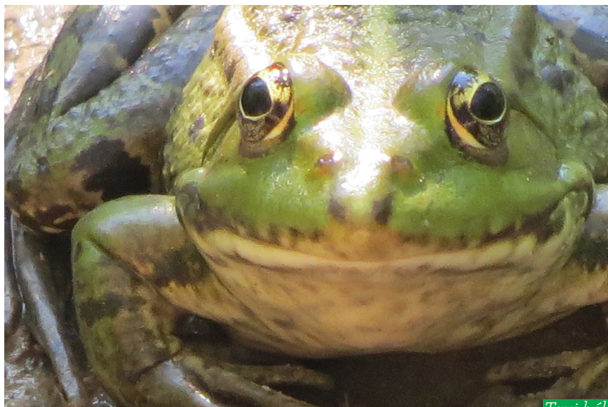
Tavi béka ( Pelophylax rudibondus )