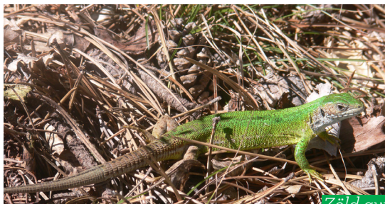
Zöld gyík ( Lacerta viridis )

A tervezők a gyerekekre is gondoltak, számukra 36 db játékos feladatokat