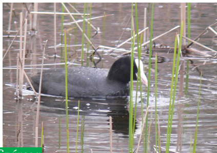
Szárccsa ( Fulica atra )