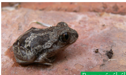
Barna ásóbéka ( Pelobates fuscus )

A vizes élőhely kételtűekben természetesen nagyon gazdag. Gyakori a pettyes götte, barna varangy, zöld varangy, barna ásóbéka, erdei béka, gyepi béka, tavi béka és a levelibéka.