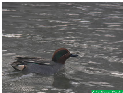
Csörgőréce ( Anas crecca )

A Sziget további fontosabb középületeit felsorolásszerűen említjük: MAC Sporttelep, Palatinus Strandfürdő, Hajós Alfréd Nemzeti Sportuszoda, Víztorony, Szabadtéri Nagyszínpad.