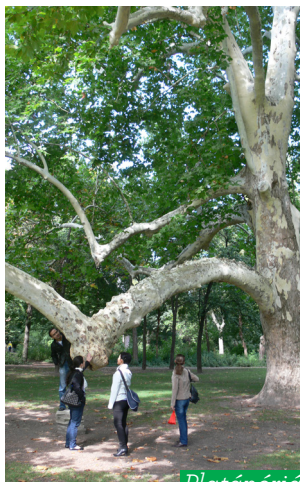
Platánóriás ( Platanus acerifolia )

Visszafordulva az északi szigetsúcstól elhaladunk a modern Danubius Thermal Hotel (az egykori Margit fürdő helyén) és a patinás Ybl Miklós által tervezett neoreneszánsz Danubius Grand Hotel előtt és máris a rekonstruált premontrai kápolna állít meg középkori szépségével a Művész sétányon haladva.