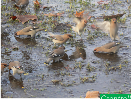
Csonttollú ( Bombycilla garrulus )

II. világháború alatt elkészült az Árpád-híd, ezt 1950-ben kötötték össze a szigettel, amin számos értékes növény- és állatfaj talál menedéket. A pihenő, sétáló emberek gyakran láthatnak itt feketerigót, harkályféléket (pl. közép- és nagy fakopáncs), parlagi galambot, széncinegét és csusz-