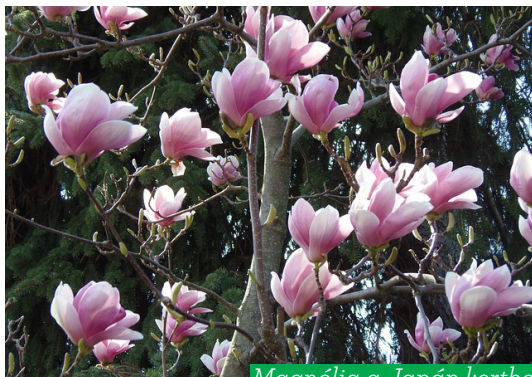
Magnólia a Japán kertben (Magnolia grandiflora)

A Margitsziget ma a XIII. kerülethez tartozik, eredeti terjedelme 58 hektár volt, mai kiterjedése szűken 1 km 2 . Földtörténeti-földrajzi szempontból Budapest legfiatalabb felszíni képződményei közé tartozik. A Dunakanyart elhagyva, alföldi szakaszra kilépő Duna a földtörténeti jelenkor elején számos zátonyt épített. A Margit-sziget alapját adó hordalékkúpja természetes állapotban nyugat felé alacsonyabb, kelet felé magasabb volt. Mai formáját a XIX. század közepén, a Duna szabályozásakor nyerte.