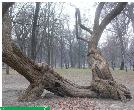
Narancseperfa ( Maclura pomifera )

A Szabadtéri színpad (1938) délnyugati sarkánál öreg tölgyek magasodnak. Alattuk kopjafa hirdeti, hogy Arany János kedves fája voltak (a költő mellszobra is itt van, egyike a sziget több tucatnyi művészeket megőrkítő emlékének).