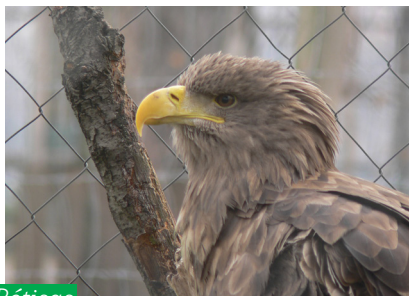
Rétisas ( Haliaeetus albicilla )

A Vadaskert egy kis állatkert, ahol nemcsak a gyerekek számára található érdekesség. A récék, tyúkok, pávák, gólyák és egerészölyvek és réti sas mellett, láthatunk itt kecskét, dámszarvasokat, őzeket, pónilovakat is. Néha még az egykori névadó nyulakat is.