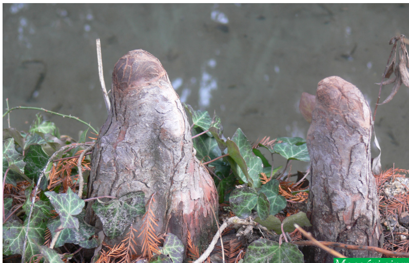
Mocsári ciprus ( Taxodium distichum )