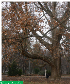
Platánfa ( Platanaceae )

Utunk során az első, történelmi időkre emlékeztető rom-együttes az egykori Minorita Ferences templom megmaradt falainak maradványa. József nádor felesége számára építtetett klasszicista nyaralója a ferencesek egykori templomának északi falához támaszkodott és pompázott egykoron,