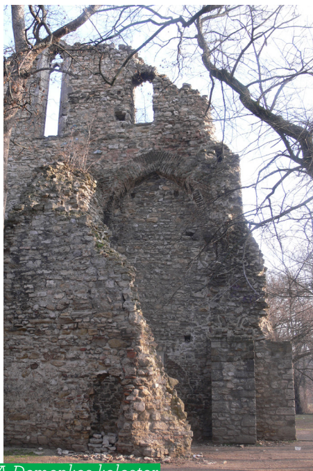
A Domonkos-kolostor romjai

Az első magyar nyelvű említés szerint Imre király (1196-1204) itt tartotta udvarát. Ez időben már létezett a premontrei kolostor, közelében Szent Pál falva nevű falucskával. Az esztergomi érseknek vára volt a szigeten az Óbuda felőli oldalon, az északi szigetcsúcson, míg a pesti parton épült IV. Béla király által ide telepített Szent János Vitézek (johanniták) nagy kiterjedésű erődítményszerű négy saroktornyos vára a déli szigetcsúc közelében (a Casino helyén). A Ferences minorita rend 1270-ben jelent meg a sziget nyugati oldalán, templomukban és kolostorukban a török időkig tevékenykedtek itt. A Domonkos-kolostor alapítása szorosan kapcsolódik a mai