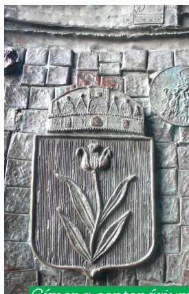
Címer a centenáriumi emlékművön

névadóhoz, Árpád-házi Szent Margithoz. A 10 éves Margit 1252-ben költözött át 17 társával a számára alapított nyulak-szigeti kolostorba, és haláláig (1271) szolgált, gyógyított a falak között. A XV. században a boldogok közé számították és 1943-ban szentté avatták. A domonkos rendi apácák 1540-ben elhagyták a szigetet és magukkal vitték Boldog Margit földi maradványait. A Sziget a XVI. századra elnéptelenedett, a szerzetesek Buda török kézre jutásakor elmenekültek.