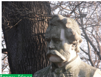
Arany János szobra

A Sziget(ek) eredeti természetes növényzetéből mára már csak hírneműk maradtak. A leghíresebbek Arany János tölgyei. Azaz... Ezek a fák csak 140-150 évesek, így a nagy költő itt tartózkodásakor igencsak ifjoncok lehettek. De az igaz, hogy Arany nyarakat töltött el a Sziget árnyas fái alatt. A hazai fajokat több fa és cserje képviseli, például: akác, berkenye, csertölgy, szelídgesztenye, hárs, ostorménfa, tiszafa, luc fenyő,