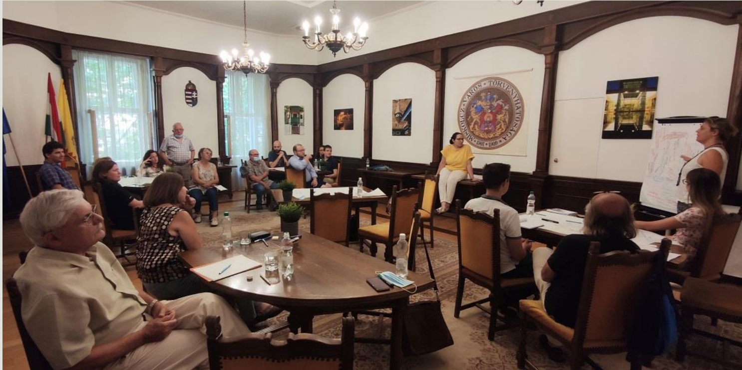
Részvételi folyamatok 2020 - 2024