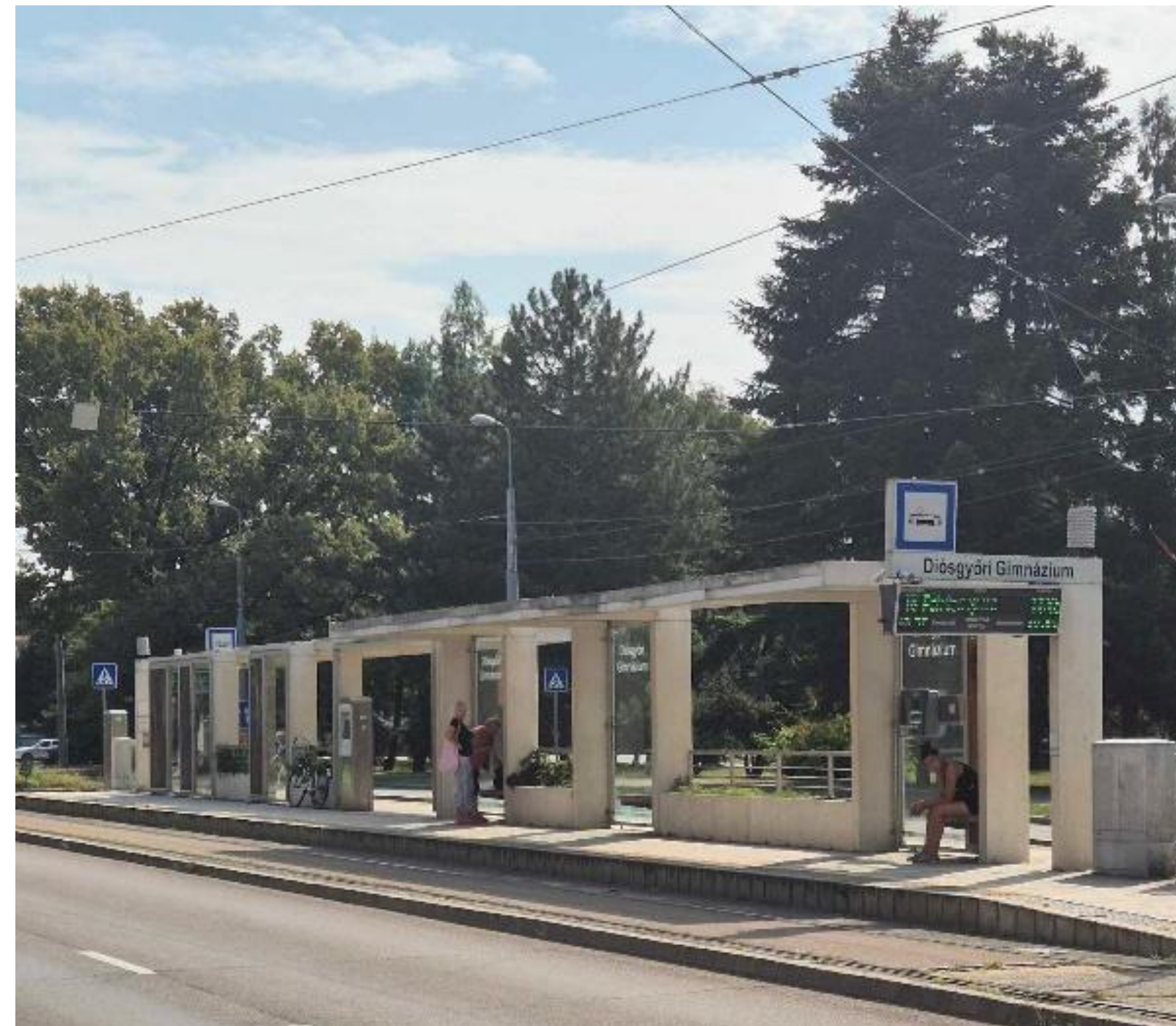
6. Villamosmegállók tetejére PV

a tanulmányban beazonosított miskolci fókuszpontok bemutatása közösségi szempontból