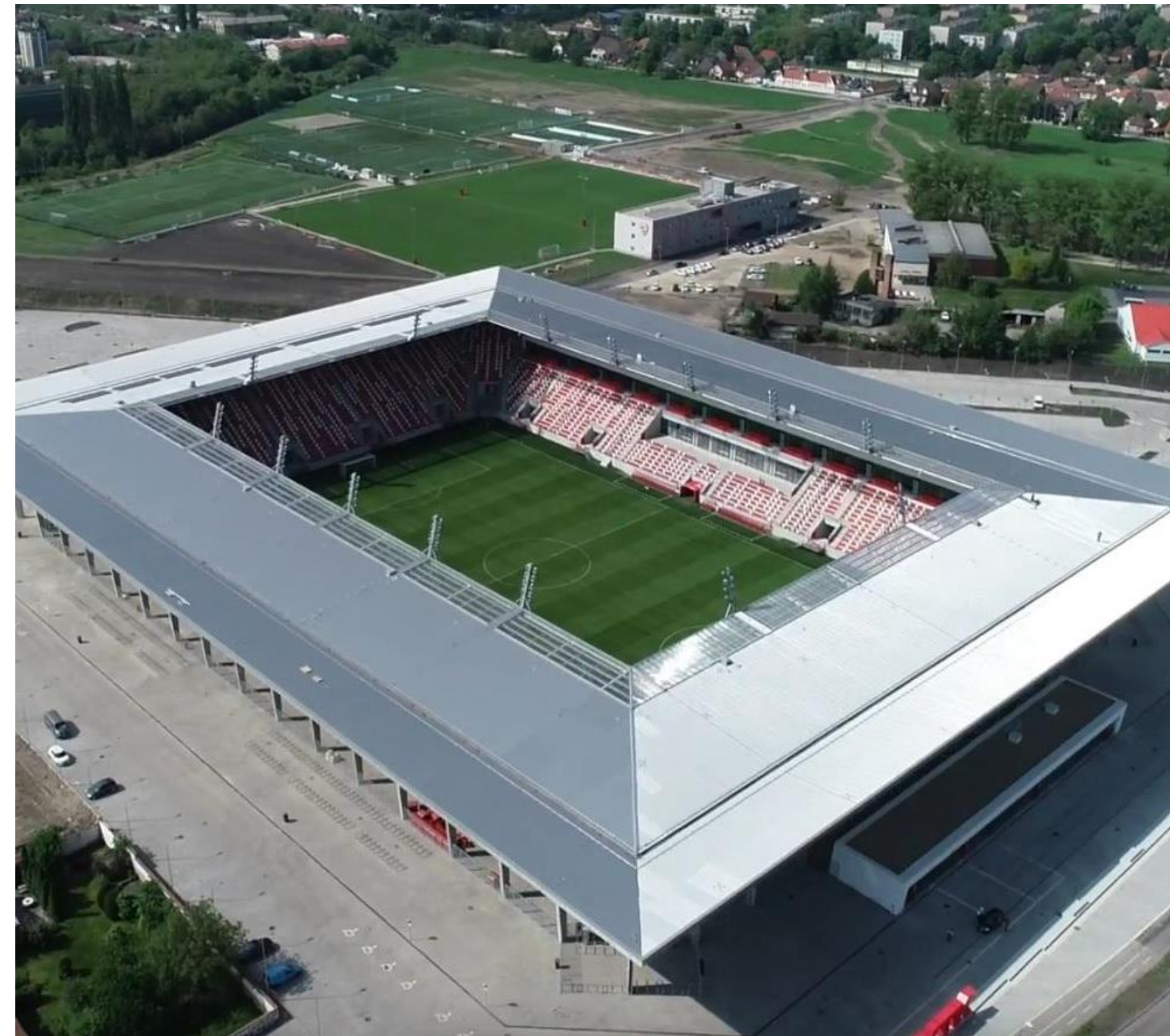
5. DVTK Stadion és sporttelep (közösségi PV)

a tanulmányban beazonosított miskolci fókuszpontok bemutatása közösségi szempontból