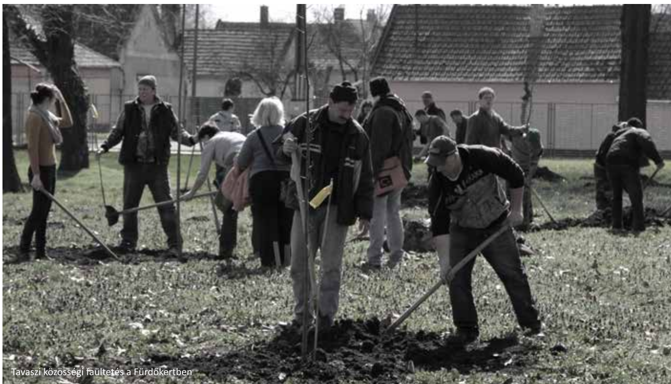
Tavaszi közösségi faültetés a Fürdőkertben

Bár a tanácsadó szolgálatunk működtetésre, folyamatos fenntartására a korábbi években rendszeresnek mondható támogatás jobbára elapadt, tartalékainkból 2013-ban is fogadtuk a lakossági megkereséseket Hajdú-Bihar megye területéről, amelyek kapcsán több esetben hatósági bejelentést is tettünk környezeti problémák kapcsán. De voltak olyan esetek is, amelyek kapcsán egyszerűen csak információkkal szolgáltunk, vagy írásos tájékoztató megküldésével igyekeztünk segítségre lenni. A legtöbb megkeresést pedig, az Észak-hajdúságban tervezett házhoz menő szelektív hulladékgyűjtő rendszer felállítása kapcsán kaptuk, elsősorban telefonos megkeresések formájában.