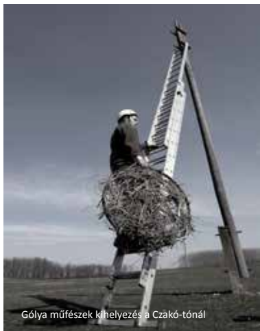
Gólya műfészkek kihelyezése a Czákó-tónál

A Zöld Kör 2013 tavaszán egy a Nimfea Természetvédelmi Egyesület, Be-Natur nemzetközi természetvédelmi programjának keretén belül vállalkozott a hajdúsági gólyák védelmére, egy néhány hónapos projekt kapcsán.