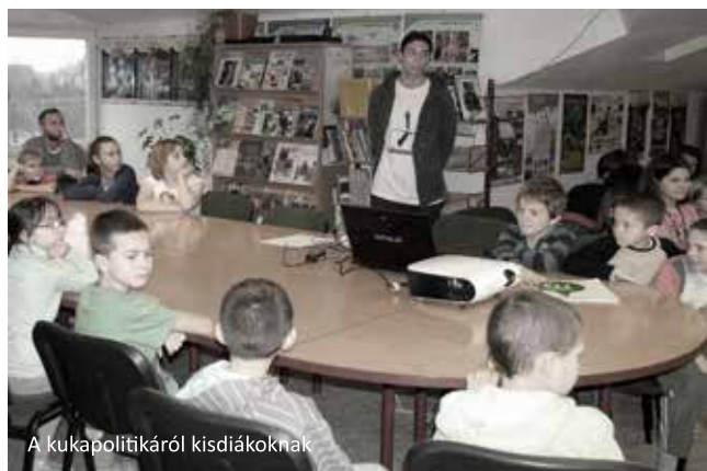
A kukapolitikáról kisdíákoknak

A szemléletformálás mellett a hulladékgazdálkodással kapcsolatban 2013-ban egyesületünk készítette a Hajdúsági Hulladékgazdálkodási cég megbízásából a cég, idén bevezetett közszolgáltatói hulladékgazdálkodási tervét. Meghatározva benne a közszolgáltató számára prioritásokat és feladatokat a hulladék begyűjtés, kezelés és ártalmatlantítás terén, középpontba helyezve a preventív megoldásokat.