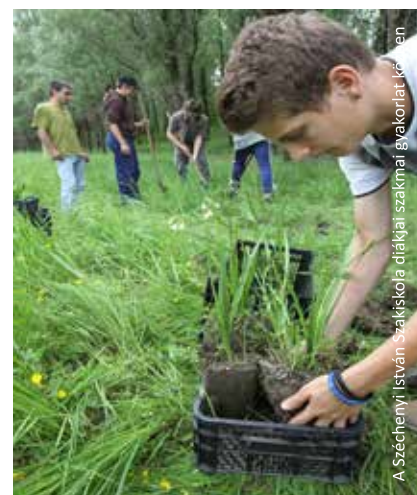
A Széchenyi István Szakiskola diákjai szakmai igavonlat közben