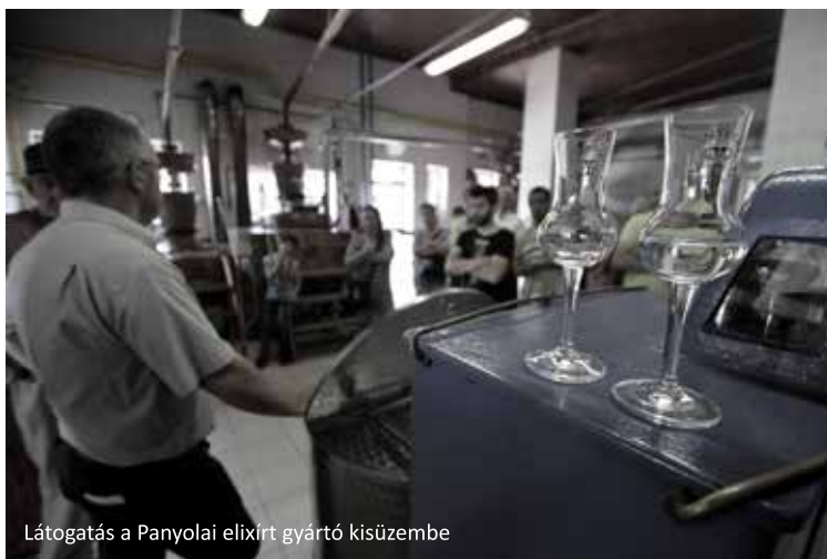
Látogatás a Panyolai elixírt gyártó kisüzembe