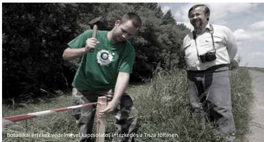
Botanikai értékek védelmével kapcsolatos intézkedés a Tisza töltésen

A nyár végéig továbbá több helyszínen és több védett fajt érintve tenyészhelyük lekerítésére, valamint maggyűjtésre is sorkerült a Tisza gáton, hogy a földmunkák ellenére a védett növények megmenekülhessenek.