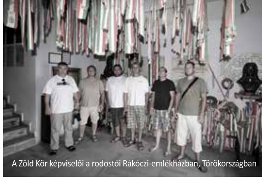
A Zöld Kör képviselői a rostosói Rákóczi-emlékházban, Törökországban