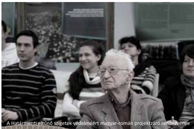
A Határmenti eltűnő szigetek védelméért magyar-román projektzáró rendezvénye

A Zöld Kör vezető partnerségével, valamint a nagyváradi Aqua Crisius szervezet – mint határontúli partner – együttműködésével, a Magyarország-Románia Határmenti Együttműködési Program 2013-2020 támogatásával megvalósuló HURO/1001/1.3.1/179 azonosítószámú természetvédelmi projekt 2012. februárjában indult és 2013 évben csupán a projekt zárásra került sor. Elkészültek a záró tanulmányok, két kisfilm a Sebes-Kőrös vidéke, a Dél-nyírség és az Érmellék természeti értékeit felvonultatva képsoraiban, valamint egy Debrecenben megvalósult záró rendezvény.