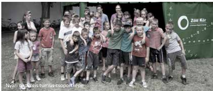
Nyári napközi turnus csoportképe