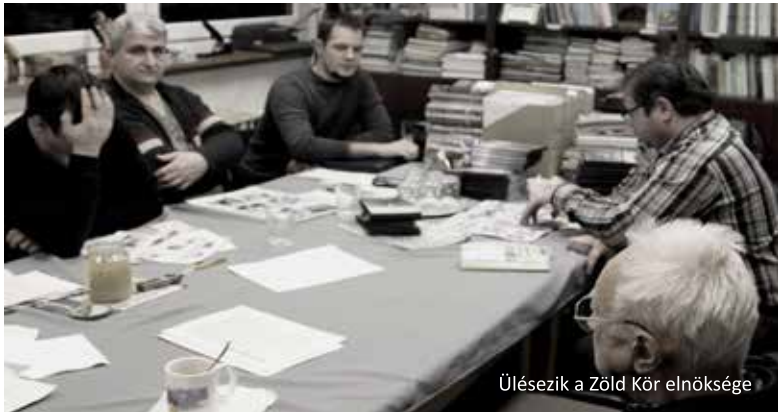
Ülésezik a Zöld Kör elnöksége

A Zöld Kör 1991-ben alakult Hajdúböszörményben, alapvetően környezet- és természetvédelmi céllal bejegyzett közhasznú egyesületként. Az azóta eltelt több mint két évtized alatt – amelynek során 2006-ban nevet és arculatot váltott a csapat – a térség meghatározó zöld szervezetévé vált a szervezet, illetve 1994 óta telephellyel rendelkezik az Borsod-Abaúj-Zemplén megyei Bodrogolaszi községben. Tevékenységeink középpontjában azóta is a szemléletformálás áll, de azok a következő elemekkel bővültek ez idő alatt: társadalmi