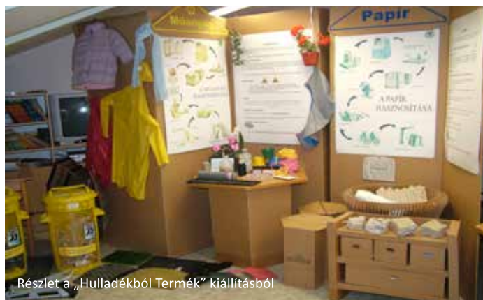
Részlet a „Hulladékból Termék” kiállításból