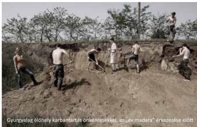
Gyurgyalag élőhely karbantartás önkéntesekkel, az „év madara” érkezése előtt