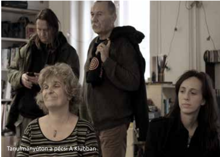
Tanulmányúton a pécsi A Klubban

A 2012 októberétől - 2013 októberéig, a Társadalmi Megújulás Operatív Program (TÁMOP) támogatásával futó projektben a hajdúvidi Vidi-ér Vidért Közhasznú Egyesülettel, valamint a hajdúnánási Okkal-Más-Okkal Ifjúsági Egyesülettel együttműködve szerveztük az önkéntességet a Hajdúságban. Ehhez három tanácsadó irodát működtettünk, az együttműködő szervezetek székhelyein, ahol az önkéntesek toborzására, szervezésére és képzésére törekedtünk. De nagy hangsúlyt fektettünk a fogadószervezetek felkutatására és felkészítésére is, különösen az egészségügy, az oktatás és a szociális területeket érintve. A projekt kapcsán több mint 160 fő felnőtt korú önkéntes bevonását értük el, amelynek kapcsán közel 5000 önkéntes munkaóra