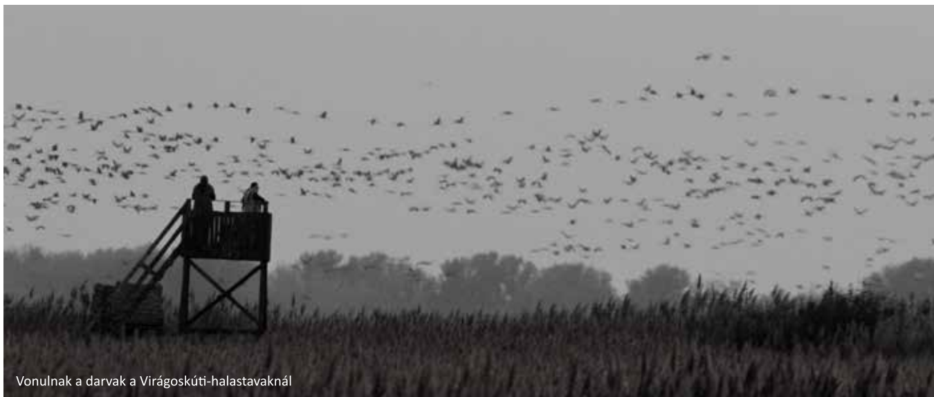
Vonulnak a darvak a Virágoskúti-halastavaknál