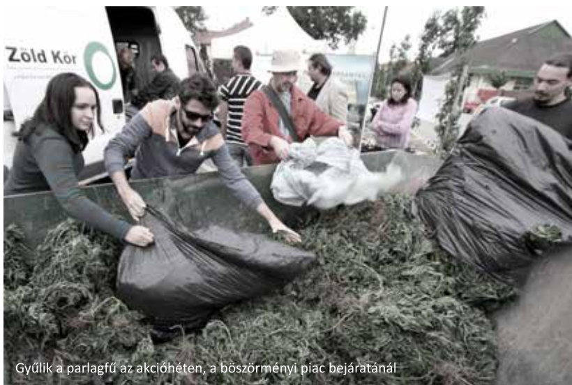
Gyűlik a parlagfű az akcióhéten, a böszörményi piac bejáratánál

Környezetünk védelméhez kapcsolódóan tavasszal és ősszel önkéntes akciók keretében 2013-ban is jelentős mértékben hozzájárultunk a Fürdőkert zöldterületének fejlesztéséhez. Tavasszal újabb – több tucat – facsemete elültetésre, ősszel pedig a kert szegélyvonala mentén védőcserjék telepítésére került sor. Június végén, pedig kezdeményezésünkre parlagfű-mentesítési akcióhét került meghirdetésre. A kezdeményezés kapcsán – amelyhez a böszörményi Polgármesteri Hivatal, valamint az ÁNTSZ is csatlakozott –, egy hétig vártuk a piacbejáratnál a lakosság által gyűjtött parlagfű töveket. Az átvétel során tanácsadó pultot is üzemeltettünk és a résztvevők között egy