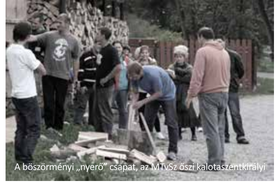
A bősörményi „nyerő” csapat, az MTV/Sz őszi kalotaszentkirályi