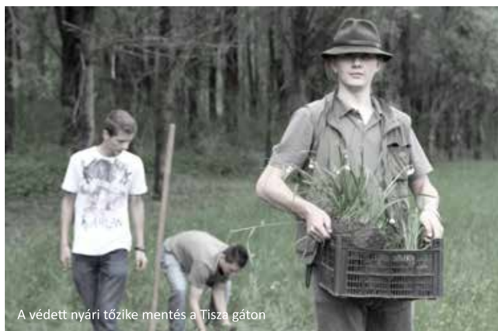
A védett nyári tőzike mentés a Tisza gáton

Szervezetünk a Tiszántúli Vízügyi Igazgatóság két-milliárdos „Tiszai védvonal fejlesztések a Tisza bal parton Tiszafüred és Rakamaz között” projektjének kapcsán, a kivitelező A-Híd Zrt megbízásából a gátmegerősítést célzó beruházása előtt, egy a beruházást megelőző hatástanulmány iránymutatása szerint vállalkozói szerződés keretében segítette a védett és veszélyeztetett botanikai értékek mentését az érintett szakaszokon.