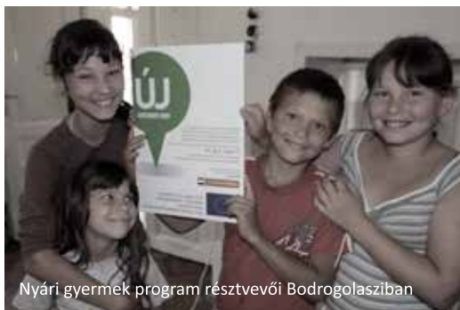
Nyári gyermek program résztvevői Bodrogolasziban