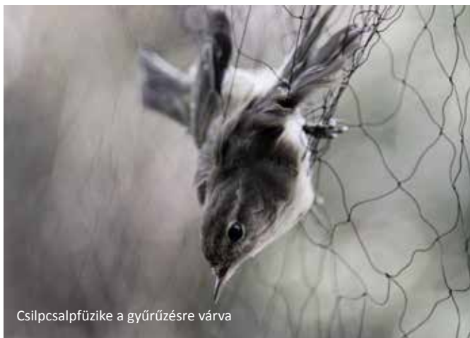
Csilpcsalpűzike a gyűrűzésre várva

A projekt kapcsán a kistérség 5 településén összesen 20 előadás is megtartásra került, alapvetően általános iskolás tanulócsoportok részére a természetvédelem népszerűsítése és a térség természeti értékeinek felsorolás szerű bemutatása kapcsán.