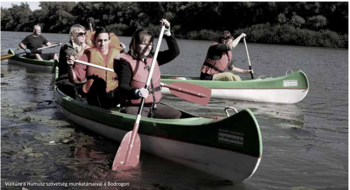
Vízitúra a Humusz szövetség munkatársaival a Bodrogon