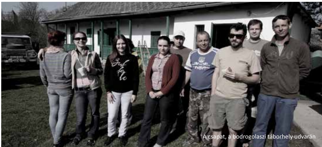
A csapat, a bodrogolaszi táborhely udvarán