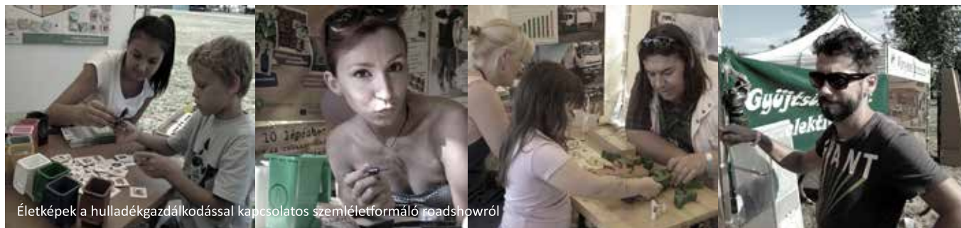
Életrképek a hulladékgazdálkodással kapcsolatos szemléletformáló roadshowról