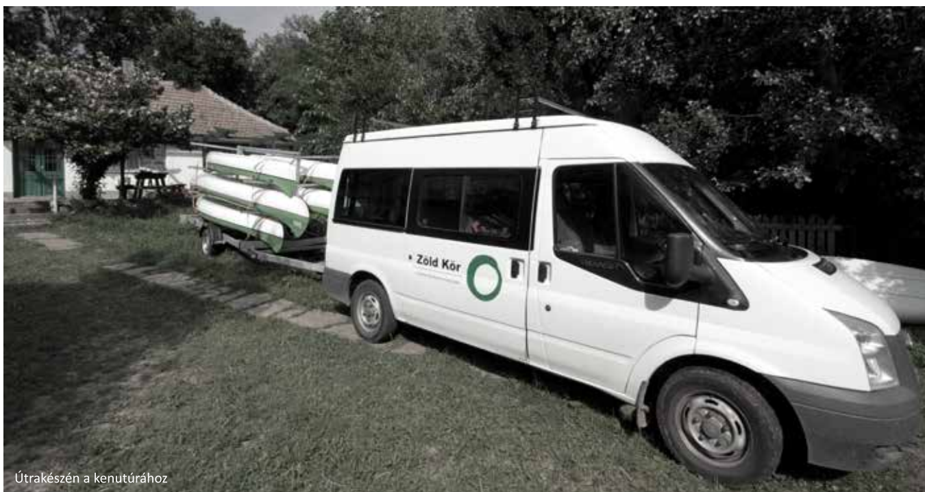
Útrakészén a kenutúrához

Vízitúrák sorában 2013-ban próbálkoztunk első ízben Bodrog-ártét túrával, amelynek köszönhetően több turnust is fogadhattunk április vége – május folyamán. De az igazán népszerű túrák idén is a Bodrog folyó teljes szakaszának bejárására vállalkozó kis létszámú csapatok által szervezett néhány napos kenutúrák voltak.