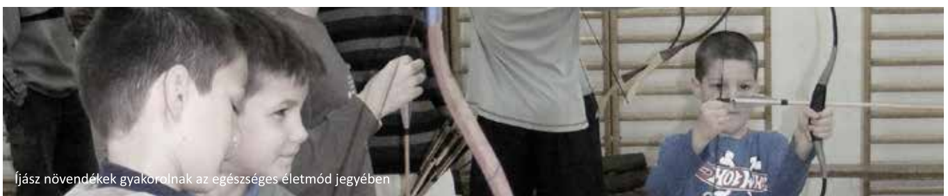
Íjász növendékek gyakorolnak az egészséges életmód jegyében

Bodrogolvaszi és Szegi község esetében hasonlóan az előbbieken ismertetett, egészséges életmód elterjesztését segítő folyamathoz, két TÁMOP projekt megvalósításában közreműködünk több elem megvalósítása kapcsán 2013/2014 folyamán. Ezekből egy Zempléni túra, valamint egy-egy egészség fórum megvalósítására került sor a tárgy időszakban.