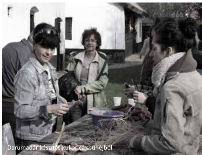
Darumadár készítés kukorica csuhéjból