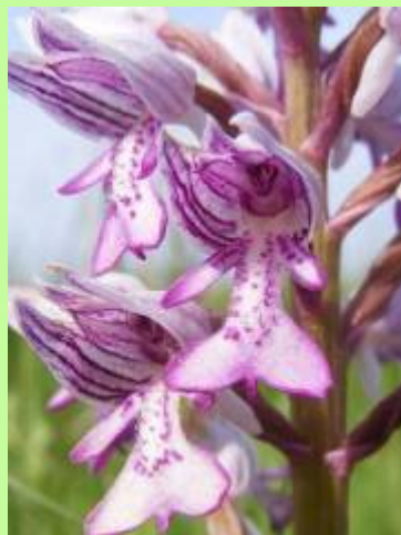
Vitéz kosbor (orchidea)