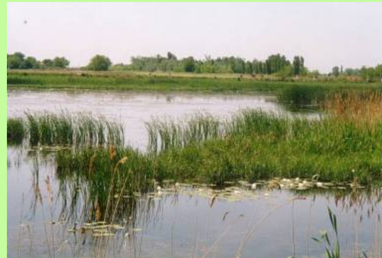
Madarász-tó (szikes tó)