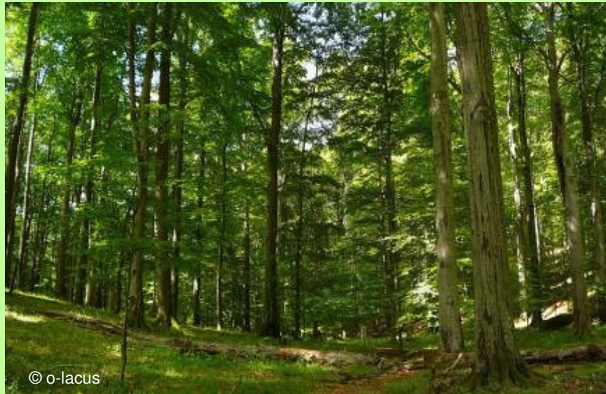
Bükk-fennsík, Őserdő Rezervátum