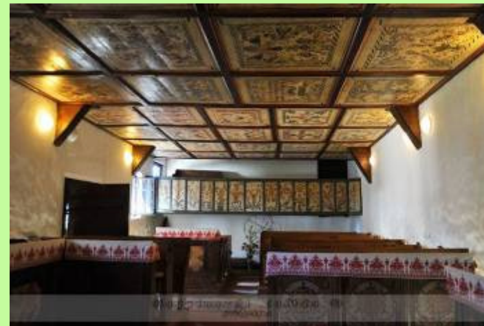
Tákos, a „Mezítlábas Notre Dame”