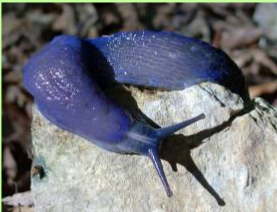
Kárpáti kék meztelencsiga