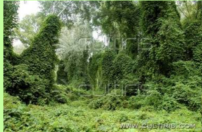
Háros-sziget, ártéri erdő