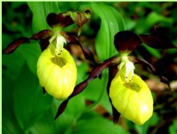
Boldogasszony papucsja (orchidea)