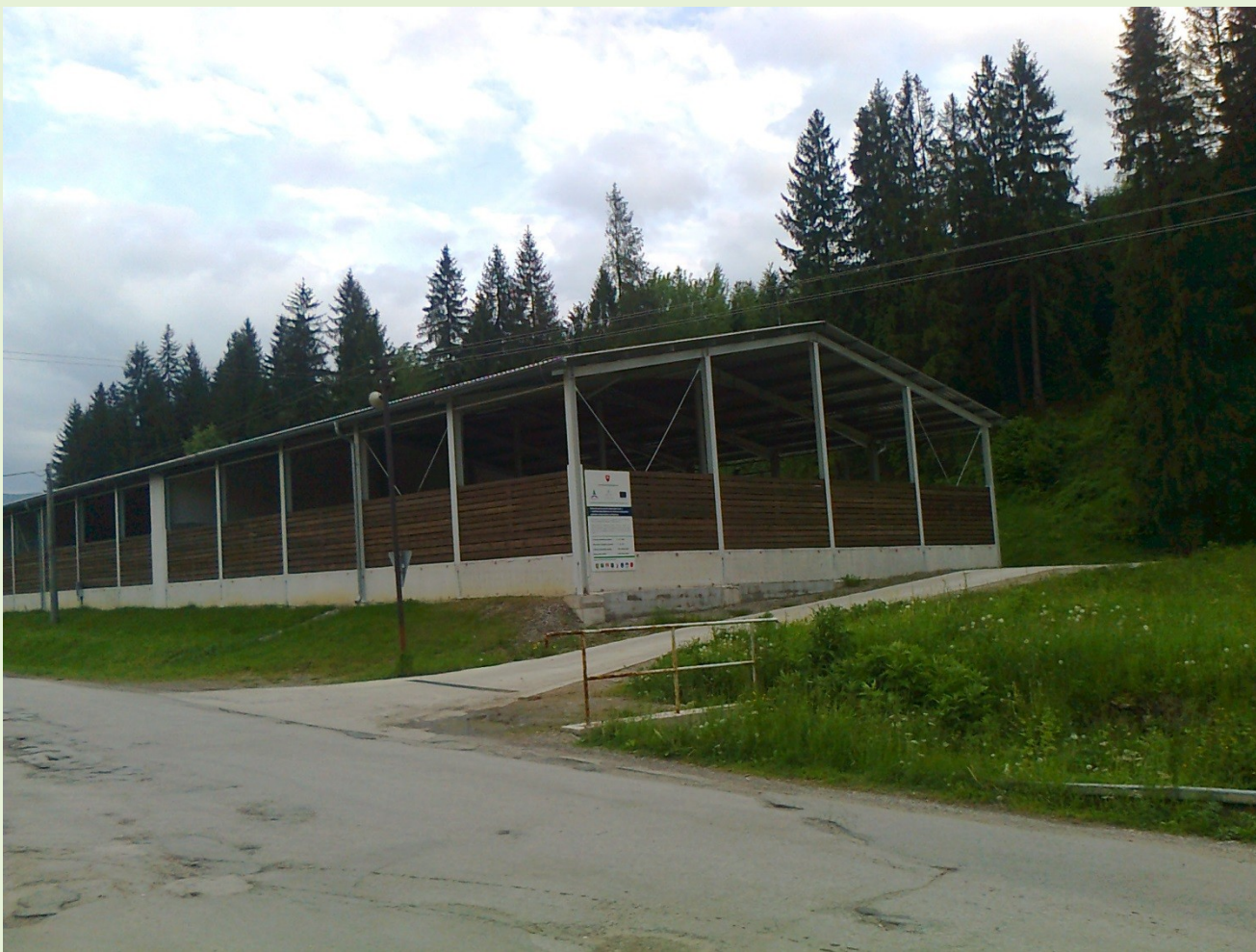
Sklad drevnej štiepky - Čierny Balog