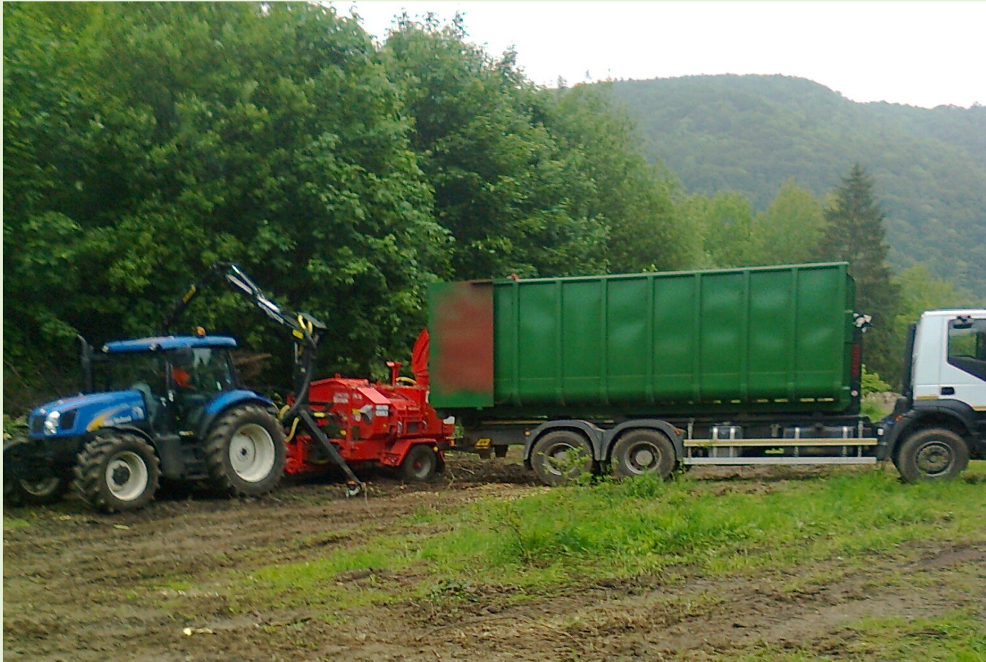
Príprava paliva – výroba drevnej štiepky