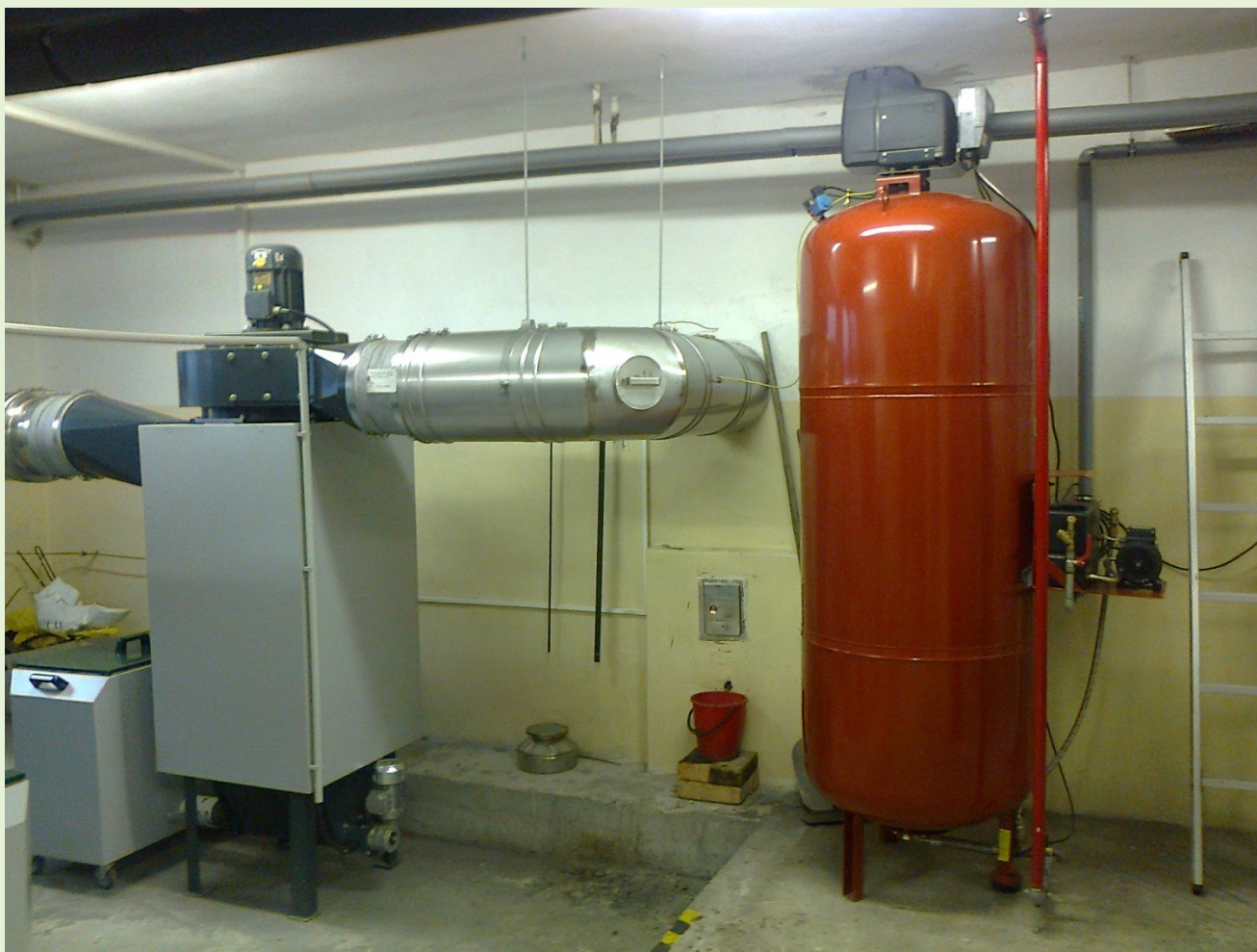
Rekonštruovaná kotelňa - Poniky