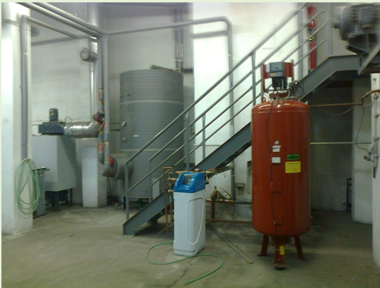
Rekonštruovaná kotolňa – Čierny Balog