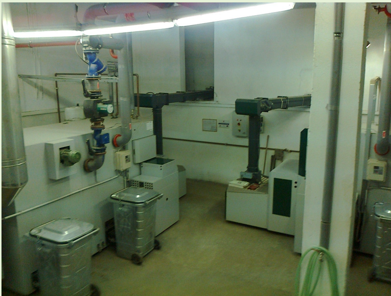
Rekonštruovaná kotolňa na drevnú štiepku – Čierny Balog