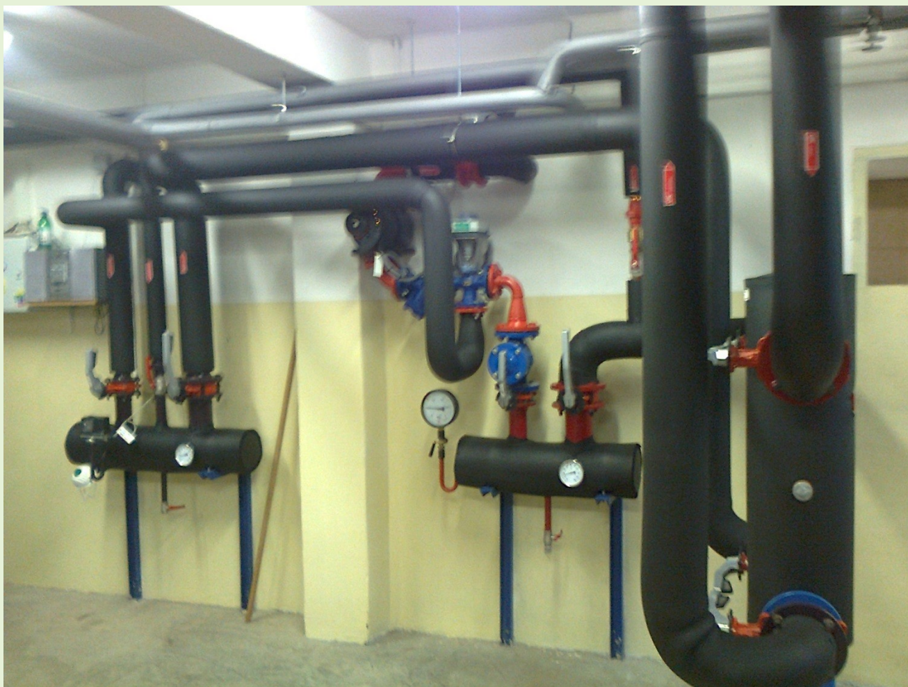
Rekonštruovaná kotelňa - Poniky