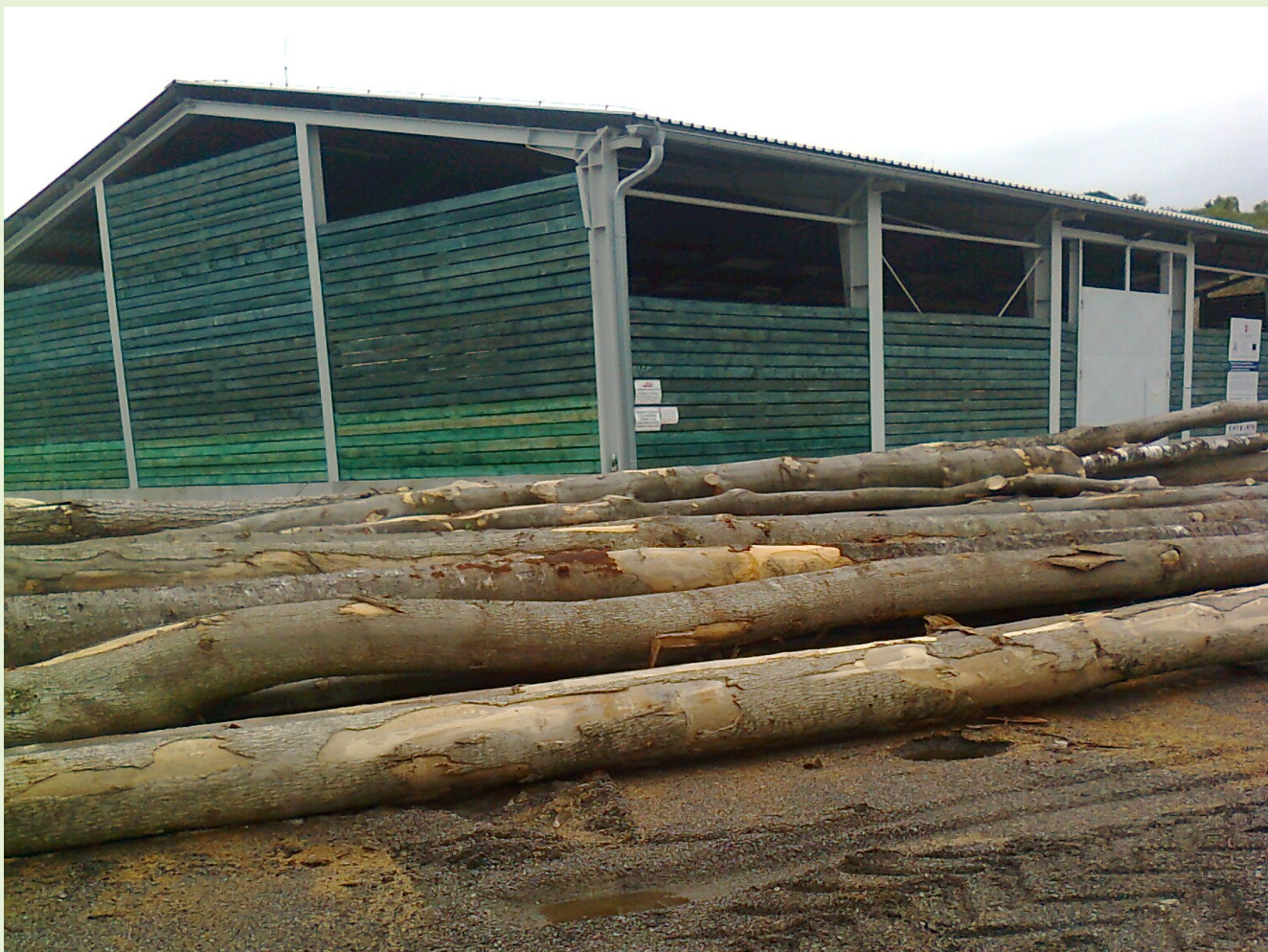
Sklad drevnej štiepky a kusového dreva - Poniky