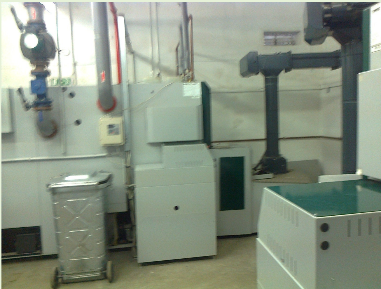
Rekonštruovaná kotolňa - Poniky