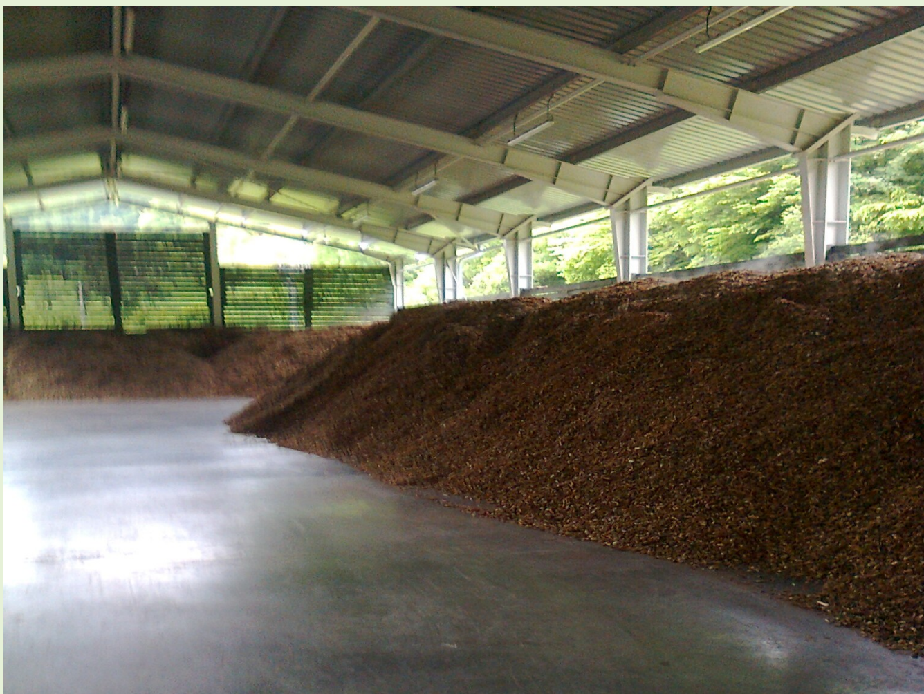
Uskladnenie drevnej štiepky - Tajov