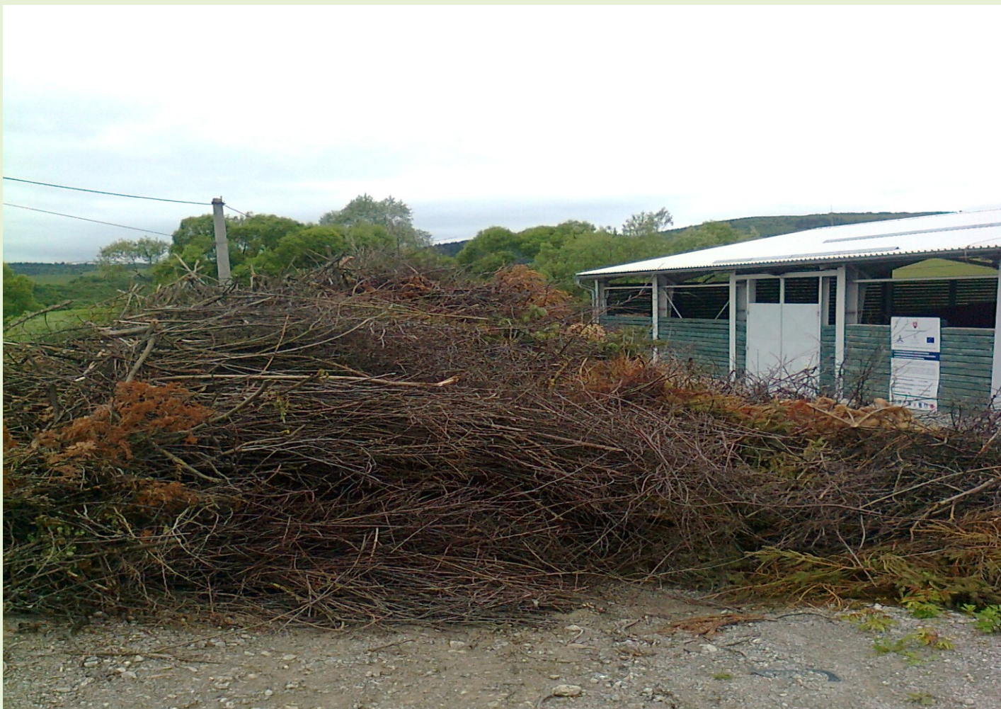
Drevná hmota po ťažbe pripravená na spracovanie