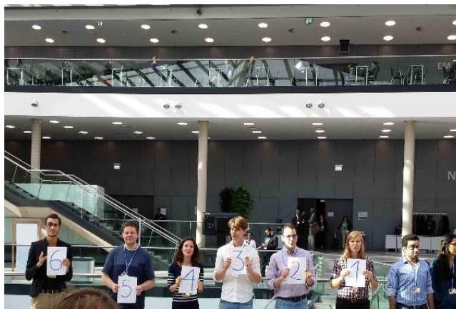
Civil „figyelmeztetés” a bonni találkozó utolsó napjának reggelén (szept. 4.): már csak 6 tárgyalási nap maradt a párizsi ülészakig (beleértve az októberi szakértői találkozó öt napját)

Ugyanakkor az eddigi előkészületek alapján erősnek látszik a magasszintű politikai akarat ahhoz, hogy 2015 végén megszülessen egy új nemzetközi jogi eszköz: egy Párizsi Megállapodás az ENSZ Éghajlatváltozási Keretegyezményének hatálya alatt. Valójában a leendő Megállapodás tartalmával és nemzetközi jogi erejével kapcsolatban jelentősek a kételyek. A fejlett és a fejlődő országok közötti ellentétek és ezen országcsoportokon belüli eltérő álláspontok miatt sem látszik valószínűnek, hogy a konkrét számszerű kötelezettségvállalásokra vonatkozóan egyértelmű, jogilag kötelező érvényű, a végrehajtásukat pontosan ellenőrizhetővé tevő rendelkezések lesznek a Megállapodásban, hanem feltehetően csak a vonatkozó általános eljárási szabályokat írják elő kötelező módon. E szabályok alapján lehetne elvárni mindenkitől, azaz a Megállapodáshoz csatlakozó minden országtól, hogy meghatározott határidőkre és időközönként, ill. elemekkel közléses majd konkrét vállalásait, valamint az azok végrehajtásával kapcsolatos előrehaladási jelentéseit.