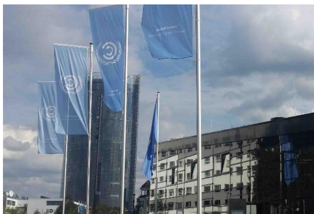
A szakértői tárgyalások helyszíne: a Bonni Világkongresszusi Központ

Az ENSZ Éghajlatváltozási Keretegyezményét 2 1992-ben fogadták el azzal a célkitűzéssel, hogy a nemzetek közös erőfeszítéssel megakadályozzák a veszélyes következményekkel járó globális éghajlatváltozás kialakulását. Az egyezménynek 196 részese van (195 ország és az EU). 1997-ben készült el az egyezmény Kiotói Jegyzőkönyve 3 , amelynek értelmében a fejlett országok az üvegházhatású gázok mintegy 5%-os kibocsátás-csökkentését vállalták 2012 végére az 1990. évi szinthez képest. A Jegyzőkönyv hatálybalépését követően – tíz évvel ezelőtt – született meg az elhatározás arról, hogy e globális probléma miatt egyeztetéseket kell kezdeni az addigiaknál sokkal komolyabb lépésekről 4 . Annak ellenére, hogy nemzetközi és sok országban nemzeti szinten is történtek különféle klímapolitikai intézkedések, mégis a probléma kialakulásáért felelőssé tett gázok kibocsátása összességében gyorsan növekedett.