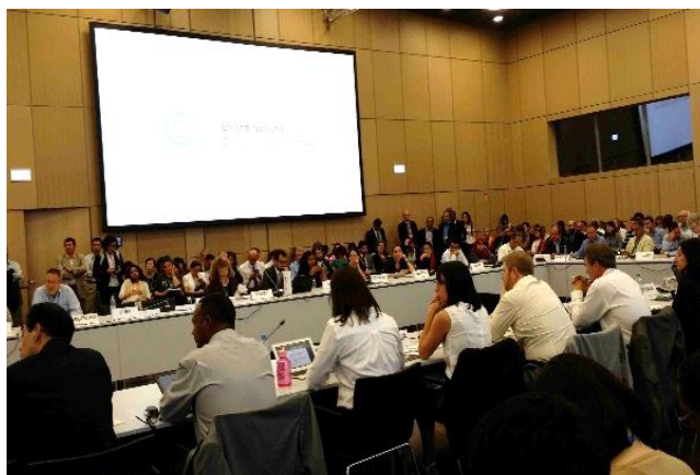
Az egyes témakörökről, azok szövegtervezeteiről külön vitatkoztak a kormányzati delegációk képviselői (a különböző érdekképviseleti csoportok tagjainak jelenlétében, akik megfigyelőként vehették részt)

A 2020-ig tartó időszakra a fejlett országok kötelezettségvállalási „tétjeinek” emeléséről és a Kiotói Jegyzőkönyv „meghosszabbításának”, azaz 2012. évi Dohai Módosításának hatálybalépéséről több mint két éve meglehetősen terméketlen vita folyik. A majd erről szóló és várhatóan elfogadásra kerülő határozattervezet általánosságban felszólítja a Módosításban érintett és az abból kimaradó fejlett országokat is arra, hogy a megígért kibocsátás-csökkentésnél többet vállaljanak, valamint teljesítsék a nemzetközi finanszírozásra vonatkozó politikai vállalásukat. Politikai szándék és egyetértés hiányában ennél több nem várható, s még az is felettébb kétséges, hogy a közeljövőben egyáltalán hatályba lép-e ez a Dohai Módosítás, hiszen ennek teljesülése nehezen elérhető feltételhez kötött: ehhez legalább 144 országnak kell hivatalosan elfogadnia e jogi eszközt, miközben eddig ennek kevesebb, mint negyvenen tettek eleget. (Egyelőre a „hiányzók” között van együtt az EU 28 tagállama is.). Ugyanakkor a fejlődő országok elengedhetetlennek tartják, hogy ebben az ügyben előrehaladás legyen és ragaszkodnának egy „szigorú” tartalmú és hangvételű határozathoz.