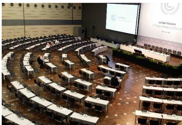
A bonni tárgyalások helyszíne: a plenáris tárgyalóterem majd októberben fog újra megtelni a résztvevőkkel

Ugyanakkor az eddigi előkészületek alapján erősnek látszik a magasszintű politikai akarat ahhoz, hogy 2015 végén megszülessen egy új nemzetközi jogi eszköz: egy Párizsi Megállapodás az ENSZ Éghajlatváltozási Keretegyezményének hatálya alatt. Valójában a leendő Megállapodás tartalmával és nemzetközi jogi erejével kapcsolatban jelentősek a kételyek. A fejlett és a fejlődő országok közötti ellentétek és ezen országcsoportokon belüli eltérő álláspontok miatt sem látszik valószínűnek, hogy a konkrét számszerű kötelezettségvállalásokra vonatkozóan egyértelmű, jogilag kötelező érvényű, a végrehajtásukat pontosan ellenőrizhetővé tevő rendelkezések lesznek a Megállapodásban, hanem feltehetően csak a vonatkozó általános eljárási szabályokat írják elő kötelező módon. E szabályok alapján lehetne elvárni mindenkitől, azaz a Megállapodáshoz csatlakozó minden országtól, hogy meghatározott határidőkre és időközönként, ill. elemekkel közléses majd konkrét vállalásait, valamint az azok végrehajtásával kapcsolatos előrehaladási jelentéseit.