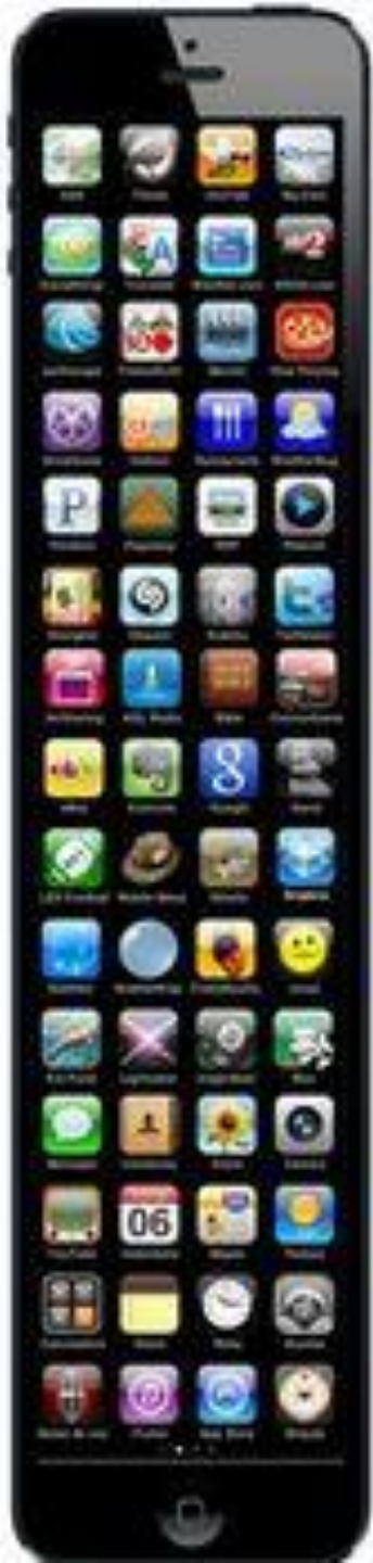
iPhone 10 The tallest iPhone yet.